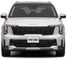
Glacial White Pearl (EX, EX PACK, SXL)