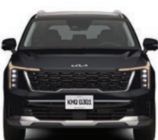
Pantera Metal Gloss (EX, EX PACK, SXL)