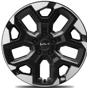
Rin de aluminio de 18" bitono EX, EX PACK