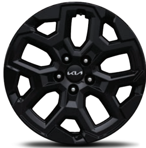
Rin de aluminio de 18" en acabado negro SXL