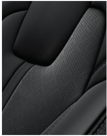
Piel artificial EX, EX PACK