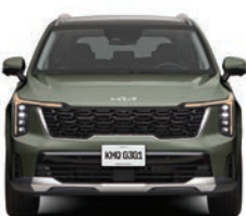
Jungle Wood Green (exclusivo SXL)

*La información sobre rendimiento de combustible combinado se refiere al valor que se obtuvo en condiciones controladas de laboratorio, de acuerdo con la NOM-163-SEMARNAT-ENER-SCFI-Vigente publicada por la SEMARNAT, mismas que pueden no ser reproducibles ni obtenerse en condiciones y hábito de manejo convencional, debido a condiciones climatológicas, combustible, condiciones topográficas y otros factores. *Por sus siglas en inglés. Para más información de los Sistemas Avanzados de Asistencia al Conductor (ADAS) consulta a tu Distribuidor Autorizado Kia. (1) Consulta si tu dispositivo celular cuenta con carga inalámbrica. (2) Android Auto™ es una marca registrada de Google Inc. (3) Apple CarPlay™ es una marca registrada de Apple Inc. registrada en EUA y otros países.