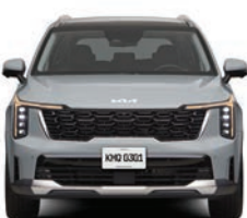
Wolf Gray (EX, EX PACK, SXL)